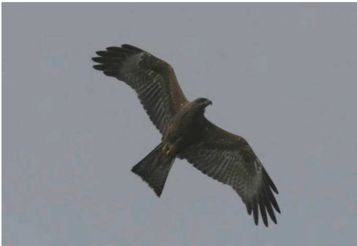
Milan noir Milvus migrans – 1 ère donnée pour la Guadeloupe (A. Levesque).

Milan noir Milvus migrans : 1 individu du 23/10 (AL, OT) au 22/11/08 (SVi) au barrage de Gaschet. NOUVELLE ESPECE POUR LA GUADELOUPE (3 ème pour les Petites Antilles).