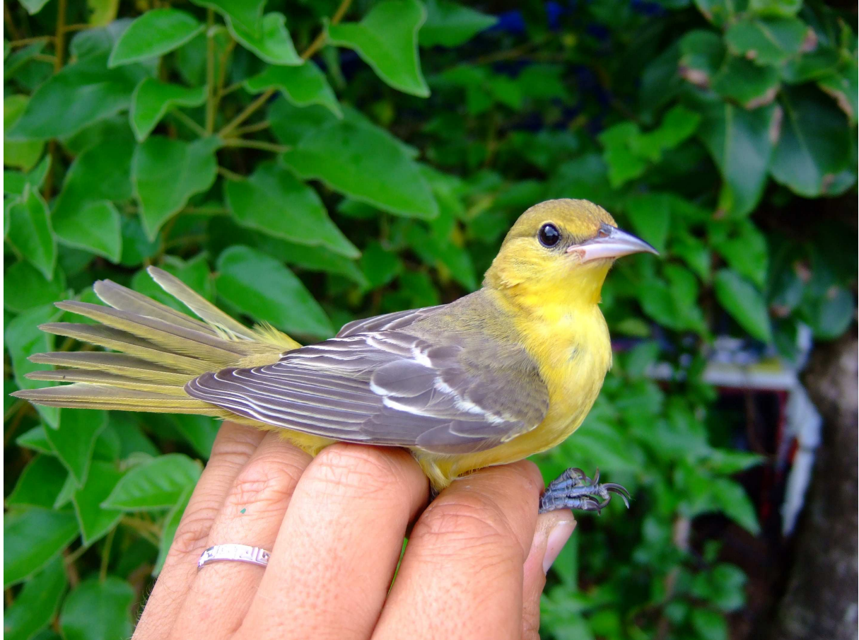
Oriole des vergers Icterus spurius – 1 ère donnée pour les Petites Antilles – A. Levesque