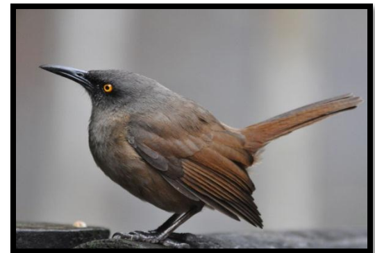
Trembleur brun – Cincloertheria ruficauda – F. Portier