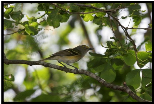
Viréo aux yeux blancs – Vireo griseus – A. Levesque