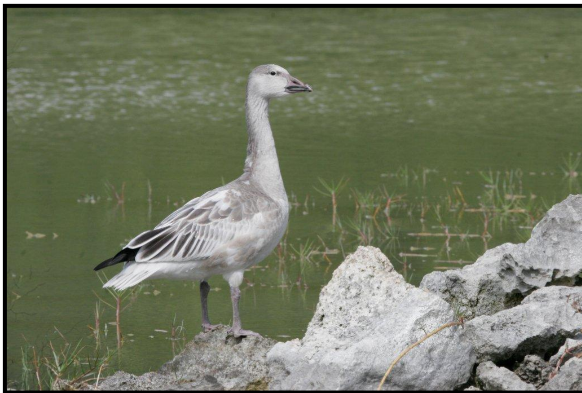
Oie des neiges Chen caerulescens – 2 ème donnée pour la Guadeloupe - A. Levesque

En Guadeloupe en 2011 , les membres de l'association AMAZONA ont observé 164 espèces (catégories A & C, c'est-à-dire d'origine sauvage ou ayant développée des populations viables en ce qui concerne les espèces introduites).