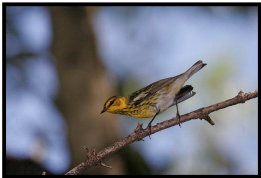
Paruline tigrée – Setophaga tigrina – A. Levesque