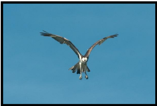
Balbuzard pêcheur – Pandion haliaetus – F. Delcroix