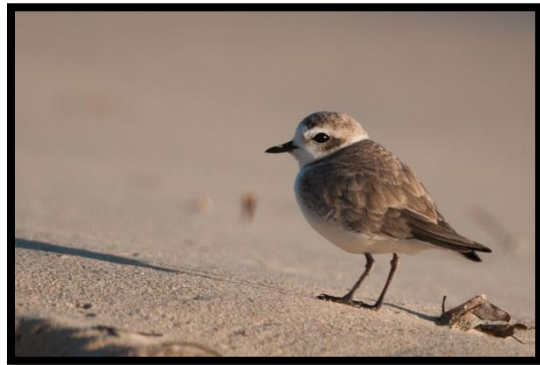
Gravelot neigeux – Charadrius nivosus – F. Delcroix