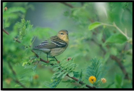
Paruline rayée – Setophaga striata – F. Delcroix