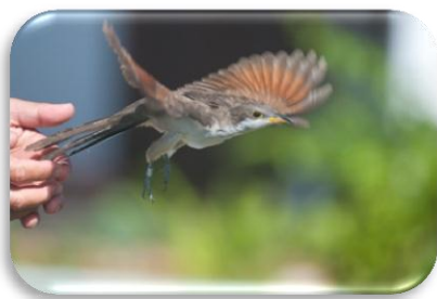
Coulicou à bec jaune au baguage à la Désirade F. Delcroix