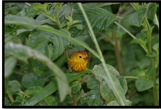
Paruline jaune – Setophaga petechia – A. Levesque