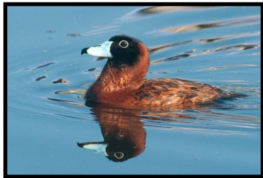
Erismature routoutou – Nomonyx dominicus – F. Delcroix